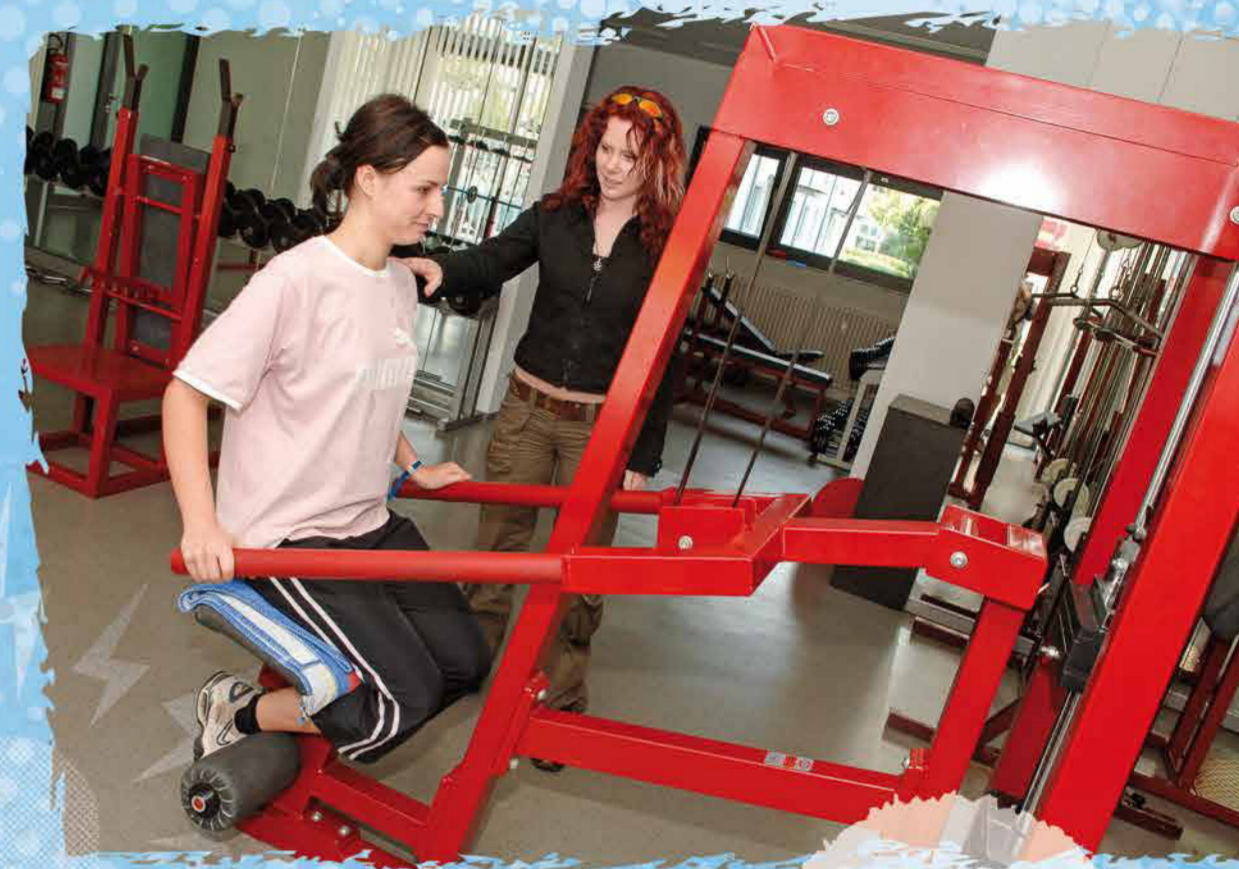
CHANEL Sport- und Fitness- kauffrau